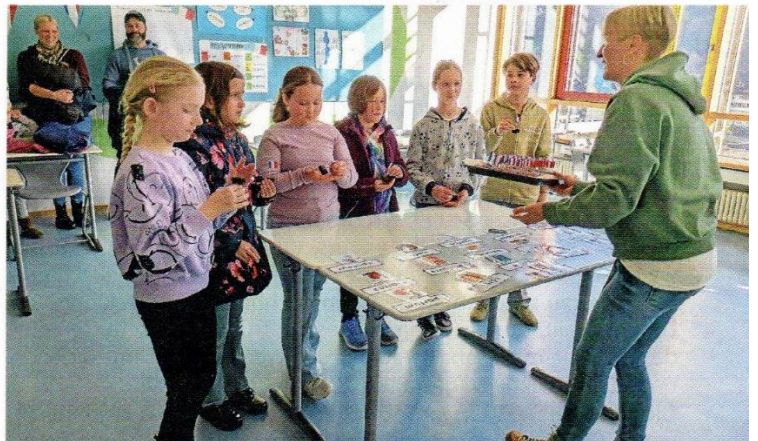
Sprachenlernen mit Genuss: Im Fach Französisch gab es neben Informationen zur Sprache auch eine kleine kulinarische Überraschung.