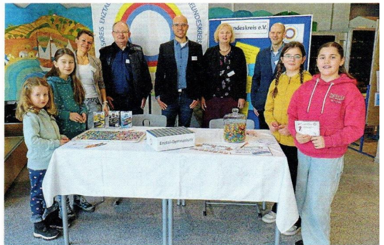
Gutes Augenmaß gefragt: Am Stand des Freundeskreises ETG e.V. versuchten Schüler, Eltern und Lehrkräfte ihr Glück beim Schätzspiel.