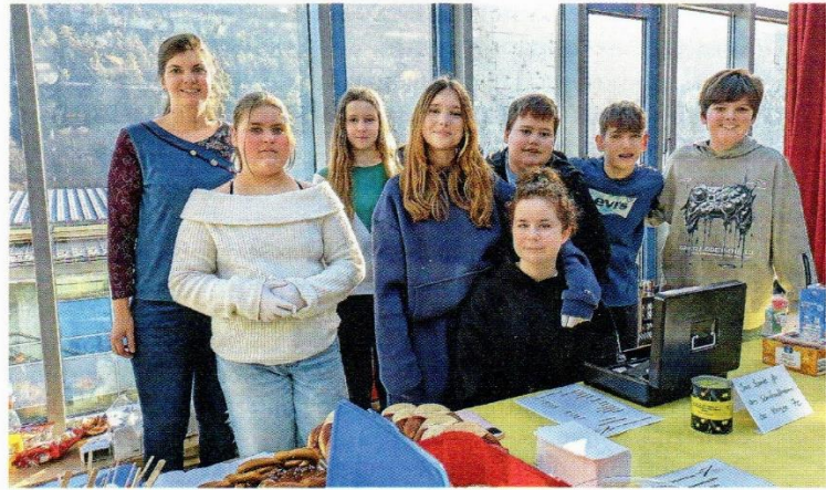
Süße Unterstützung für die Klassenkasse: Die Schülerinnen und Schüler der 7c boten ein reichhaltiges Kuchenbuffet an, um ihren Schullandheimaufenthalt in Oberstdorf zu finanzieren.